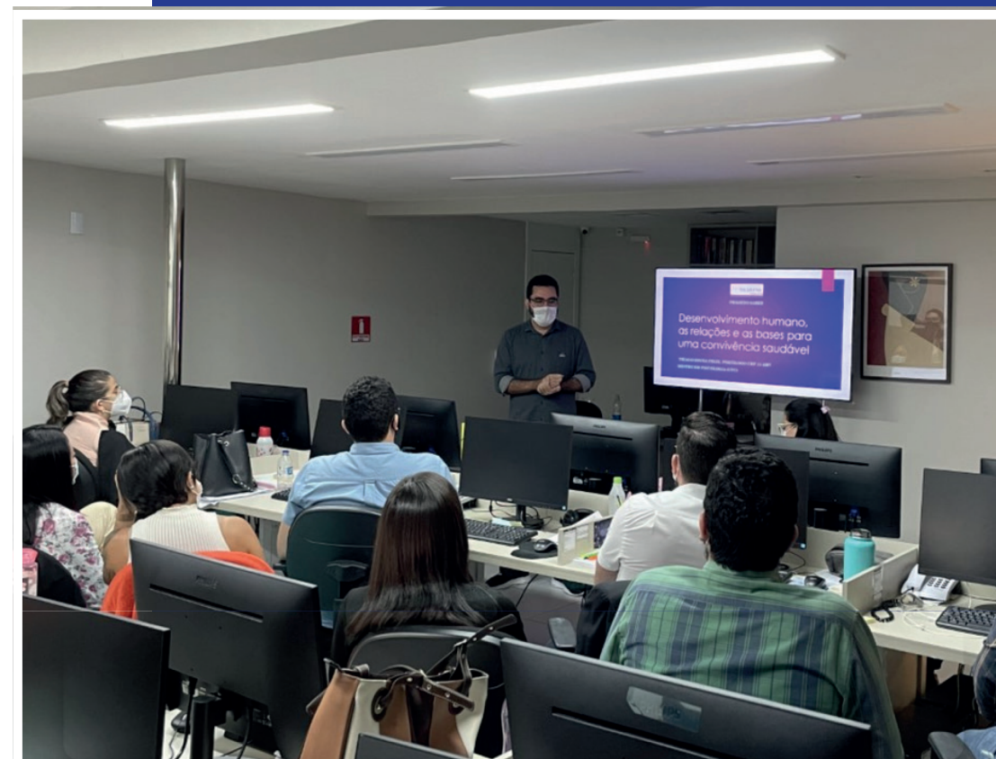
Projeto Saber - Tema em Pauta: Desenvolvimento humano, as relações e as bases para uma convivência saudável.

Essas iniciativas visam promover um ambiente mais saudável e colaborativo, com ênfase no desenvolvimento de habilidades e no cuidado com a saúde física e mental, refletindo nosso compromisso com um ambiente de trabalho completo e sustentável.