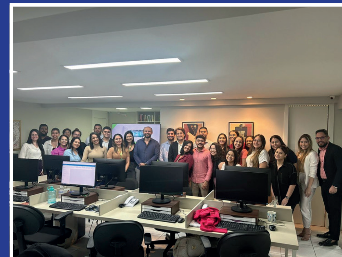
Projeto Saber - Tema em Pauta: Desbravando Caminhos Financeiros: Educação Financeira com a SICREDI