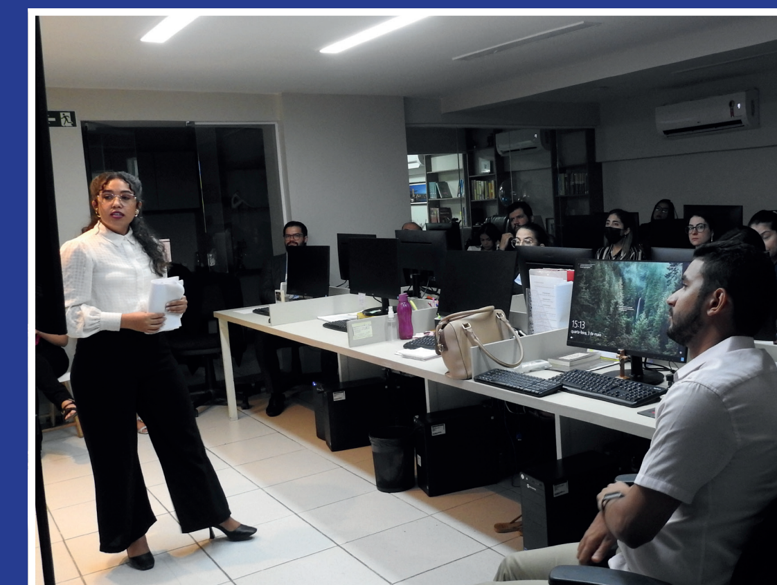
PCP Acolhe - Tema em Pauta: Setembro Amarelo: Cuidados, Conscientização e Prevenção ao Suicídio