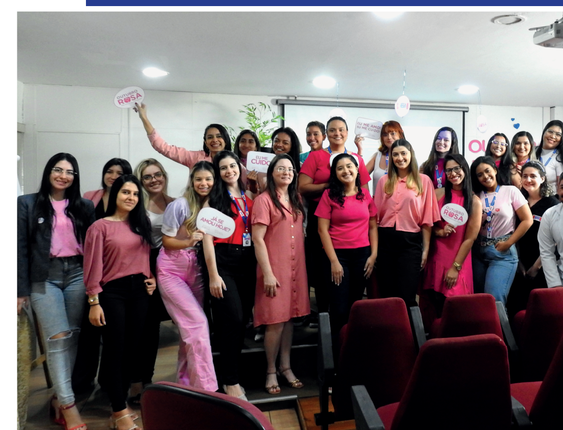
PCP Acolhe - Tema em Pauta: Outubro Rosa: Cuidados, Conscientização e Prevenção do Câncer de Mama